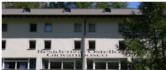
Dojo Residenza Ostello Giovanibosco

Tutti i partecipanti devono essere assicurati privatamente contro gli infortuni ed avere una copertura assicurativa in caso di ospedalizzazione e/o intervento medico in Svizzera.