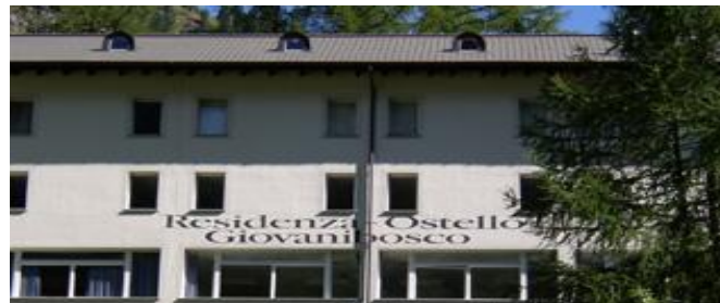
Dojo Residenza Ostello Giovanibosco

Tous les participants doivent avoir une assurance accidents qui couvre aussi d'éventuels frais médicaux et d'hospitalisation en Suisse.